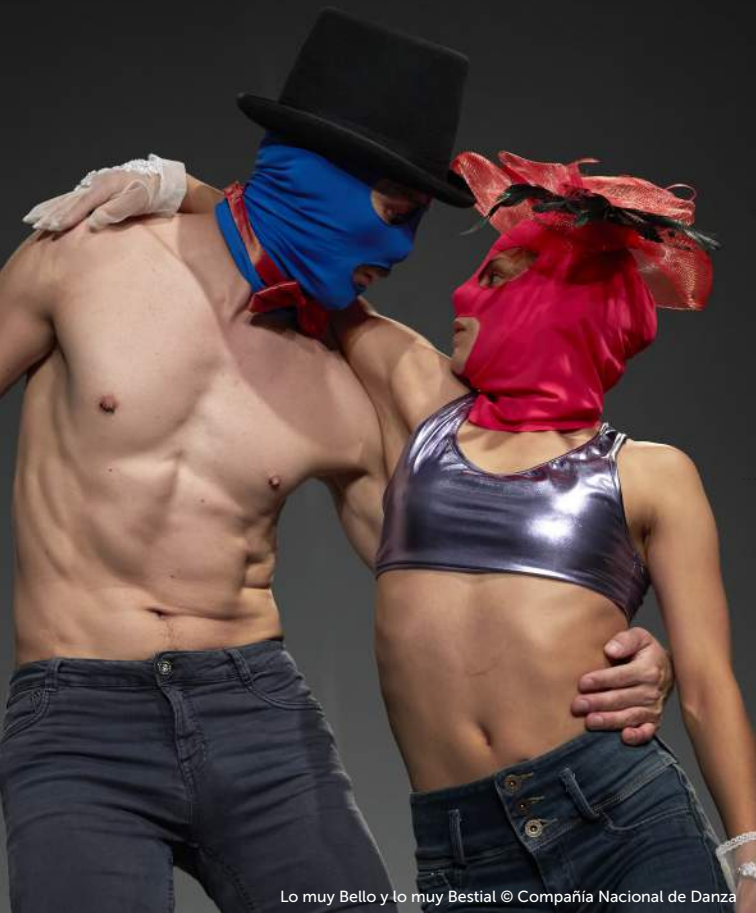
Lo muy Bello y lo muy Bestial © Compañía Nacional de Danza