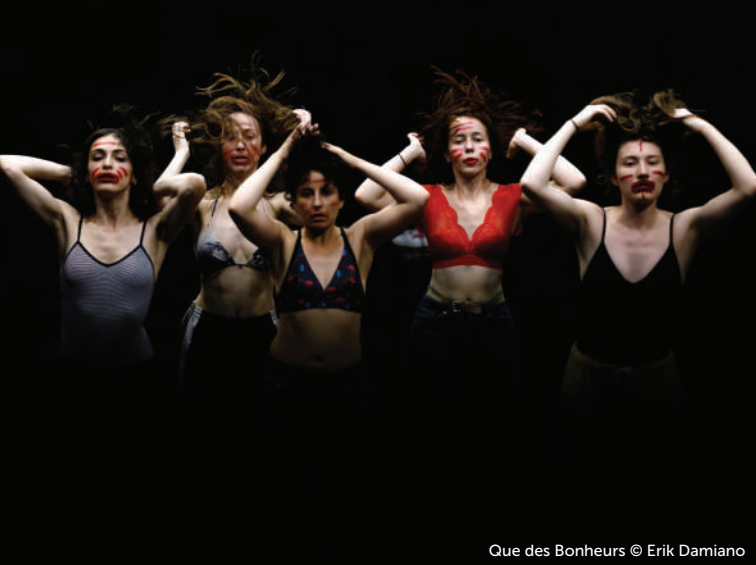
Que des Bonheurs